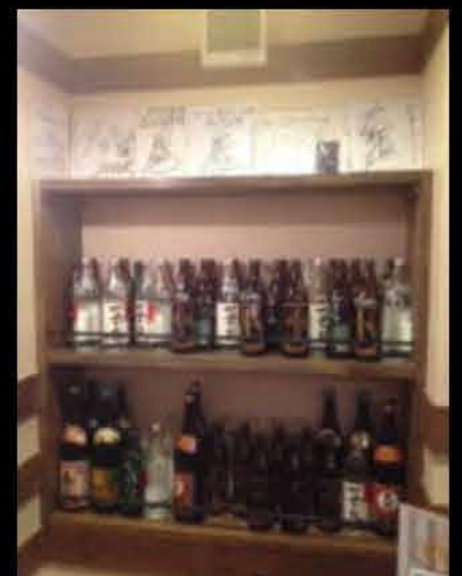
ボトルキープできます