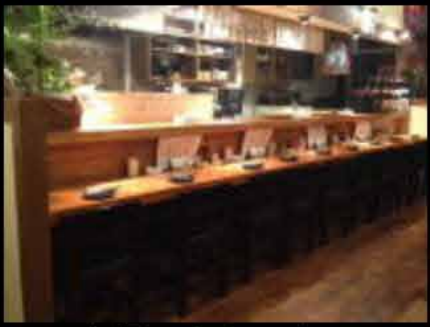
自慢のカウンター