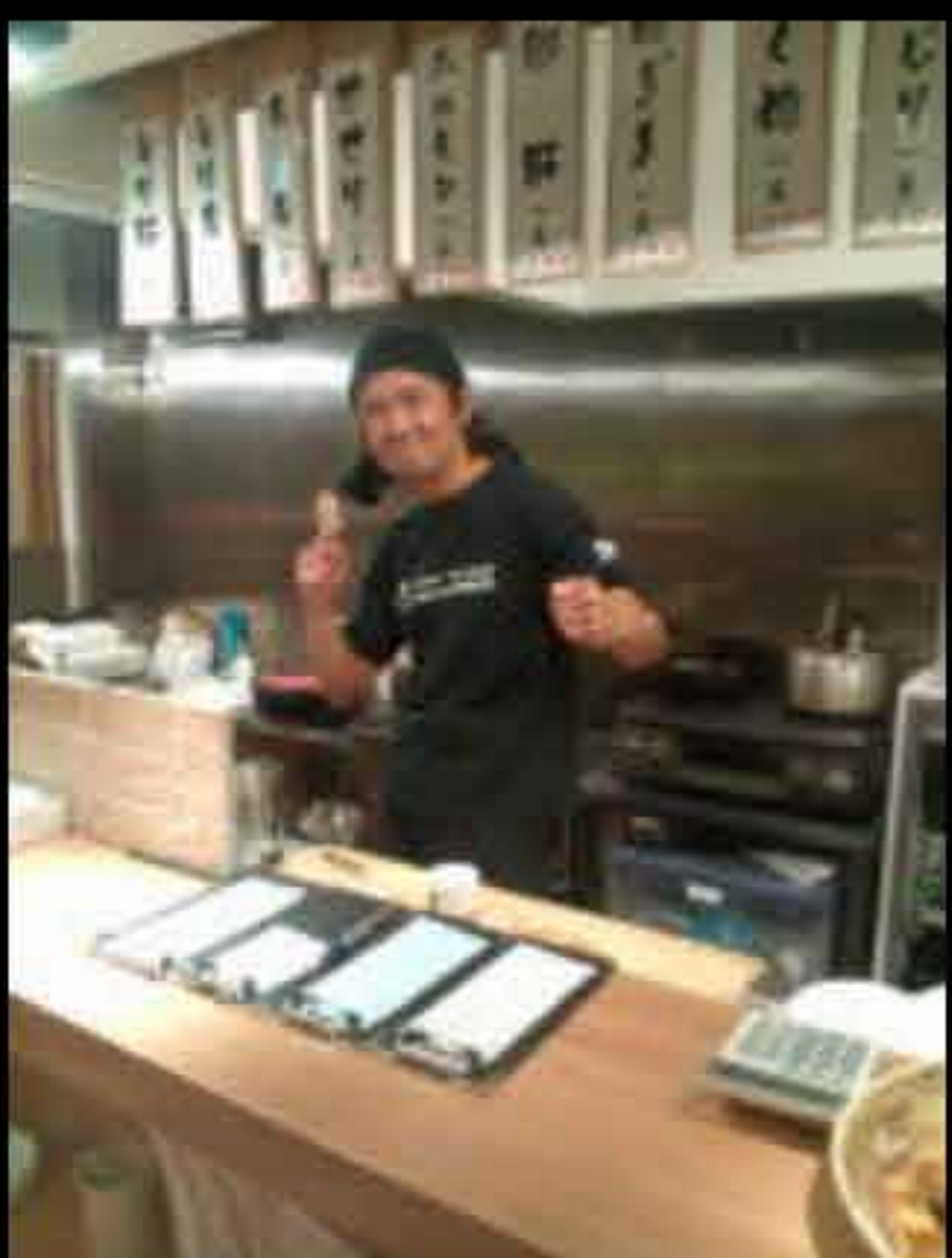
“史上最強”の笑顔で お待ちしております