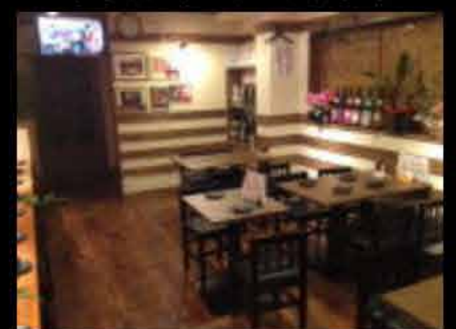
テーブル席もちろん