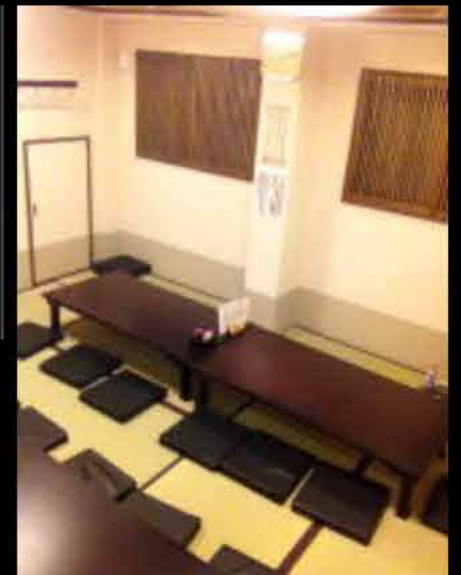
お座敷は最大25名様収容可能

🐔 電話番号はお間違えなく 🐔 📞 052-453-0200 お受け取りは店舗入口左側のカウンターにて